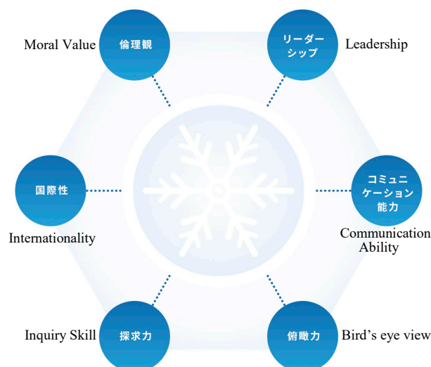
Fig. 1. Acquiring outstanding professional skills + six diversified skills to see the earth holistically and imagining its future (Snow Crystal type human resources)